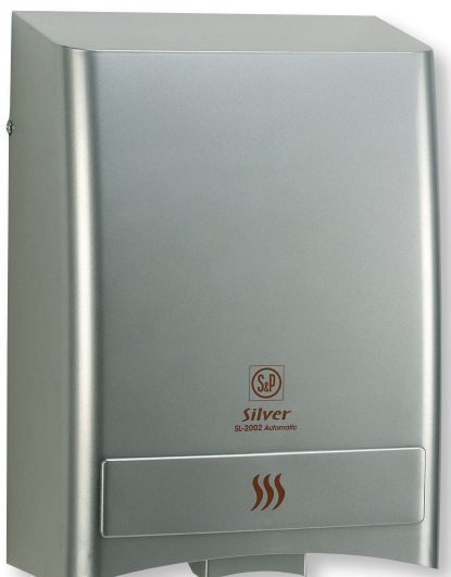
SL-2002 AUTOMATIC SILVER

Handdrogers die een aangename warme luchtstroom blazen om snel en comfortabel de handen te drogen. Uitgerust met een thermische overbelastingsbeveiliging in de motor en het verwarmingselement.